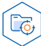
개인정보 처리 목적