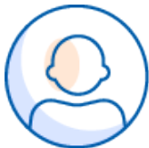
일반 개인정보 수집