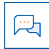
개인정보 열람 청구